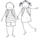
Primar- und Tagesschule Ziegelried